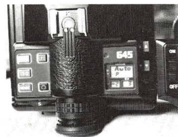
Pentax 645 betjenes via trykknapper på oversiden. I kontrolvinduet i midten af billedet fås alle ønskede informationer på en nem og overskuelig måde.

raet. Og her fungerer det faktisk både godt og logisk. Trods kameraets mange usædvanlige funktioner bliver man overraskende hurtigt dus med dem.