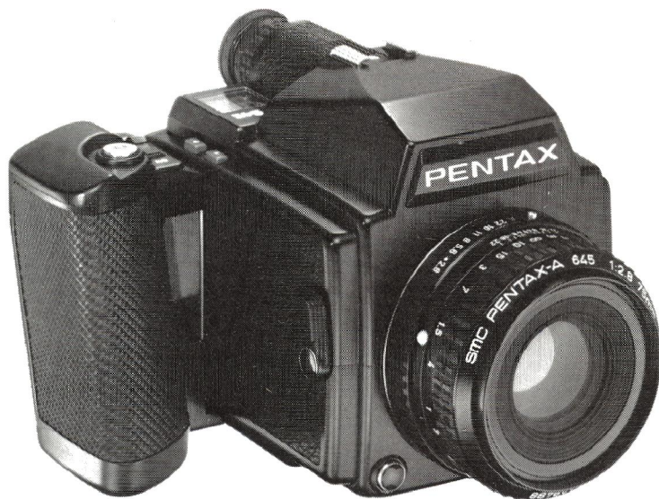
Pentax 645 har alle de faciliteter, man kender fra den programstyrede Pentax Super A til 24x36 formatet. Derudover har kameraet bl.a. okularjustering og indbygget filmwinder.

Alt dette var dog intet værd, hvis kameraet ikke samtidigt er handy at arbejde med. Og her kan det undre, at Pentax ikke har valgt at udforme sin Pentax 645'er à la 24x36 SLR-kamera – sådan som fabrikken har